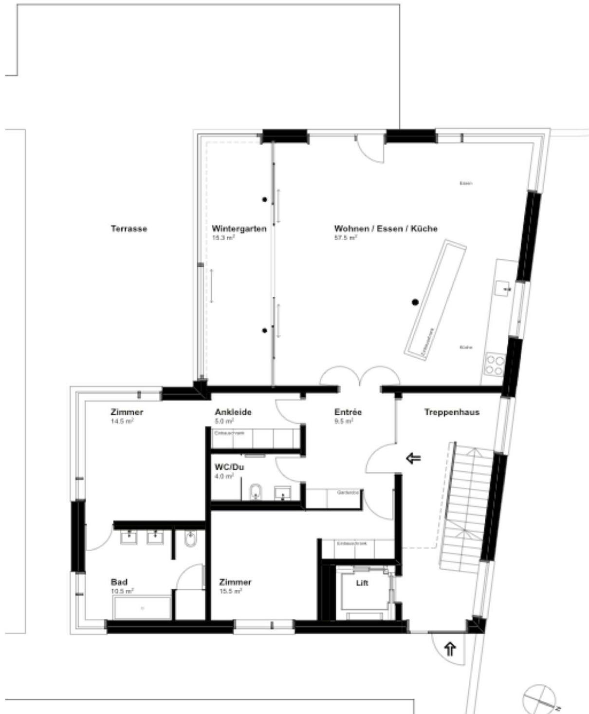
Grundrissplan Erdgeschoss, nicht massstäblich