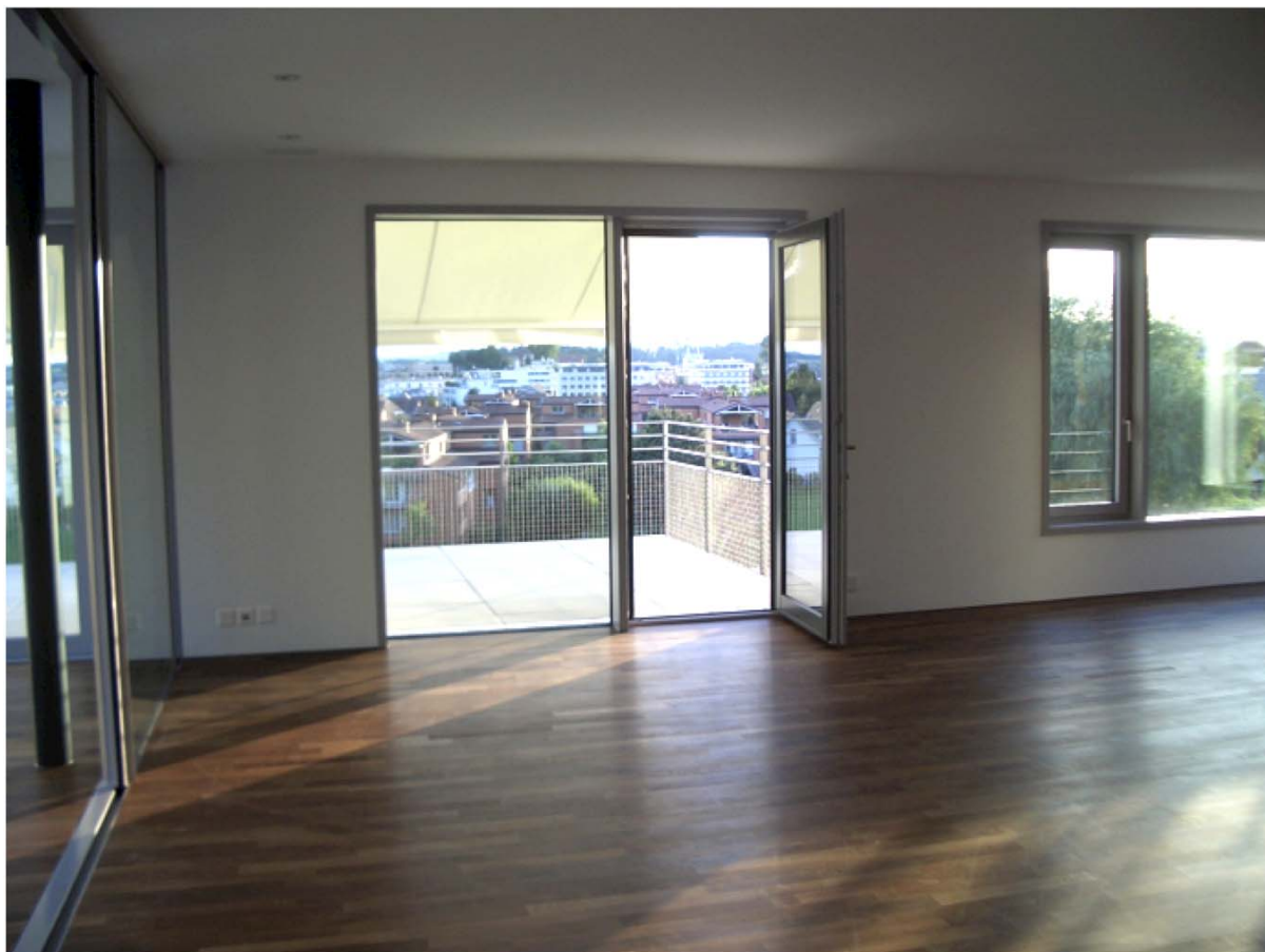
Wohnen / Essen 1