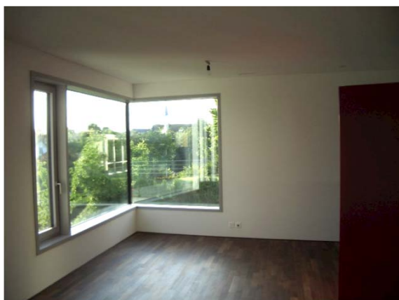
Wohnen / Essen 2